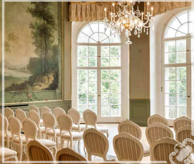
Festsaal im Schloss